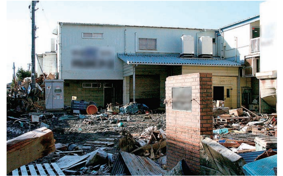
水産工場の倉庫は津波の被害を大きく受け、いくらわかめなどの原料調達が困難になった