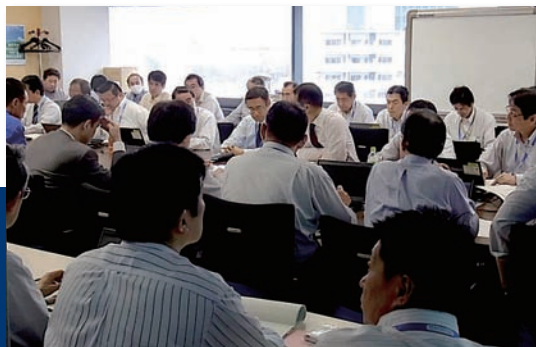
本社会議室で、1日3回情報共有のための会議が実施された