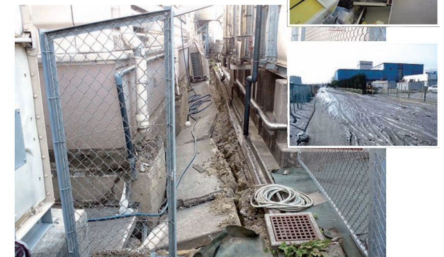
船橋市のB工場は液状化の影響で大きな損傷を受けた

担当者の言葉は、悲痛なものだった。「無理を言わないでください。我々も被災者なんです」