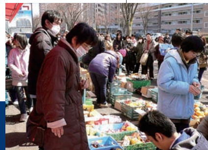
3月末になると、徐々に商品が並び始めた(写真は宮城県内のローソンストア100)