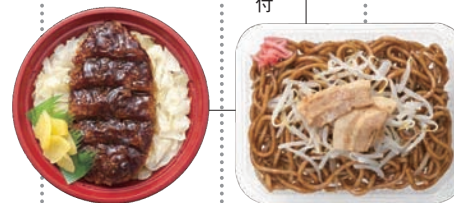
地元の監修や協力を得て商品化を進めた