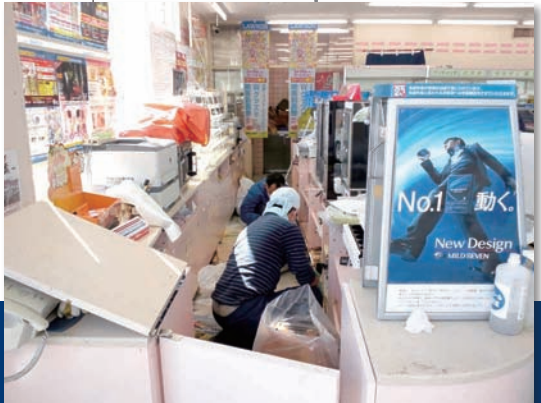
応援隊は泥だらけの店舗の清掃などに協力した