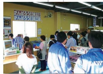
倉庫を改造した店には、連日、お客様が訪れている

「夢を応援基金」の奨学生などを招待してライブとトークイベントを開催。音楽プロデューサーの小林武史氏、アーティストの青野氏を迎えて