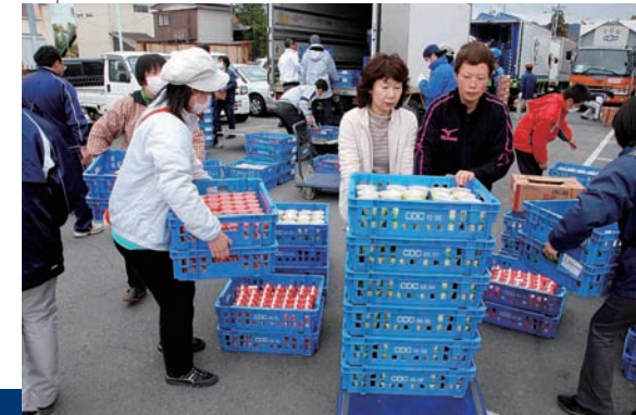
給食センターの復旧が遅れていると聞き、給食代替の弁当を提供することを決定した

相馬市の給食センターが稼動するまで、4月20日～22日までの3日間、1日3459食の弁当などを給食の代替として相馬市に提供