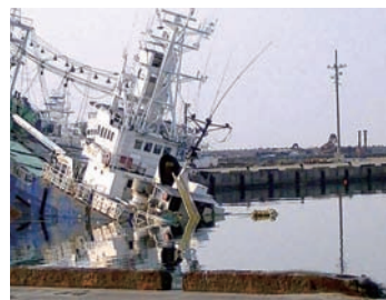
相次ぐ余震が被災地の復興を遅らせた

千葉県船橋市の臨海部に立地するため、液状化現象などの影響で大きな被害を受けていたが、懸命の復旧作業で立ち上がった(↓21ページ)