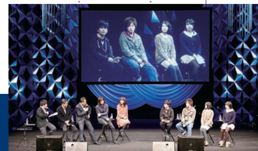
生徒たちはトークセッションで各々の夢を語った