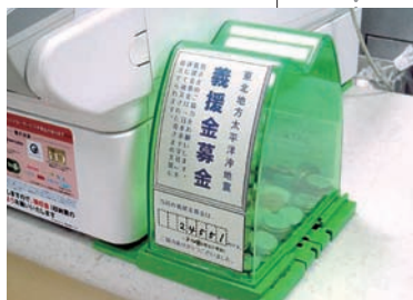
義援金はローソン、ローソンストア100、HMVの店頭などで募った

温かいご支援をいただき、店頭募金の総額は3月31日時点で5億288万8633円。Pontaポイント募金は3109万8806ポイントに