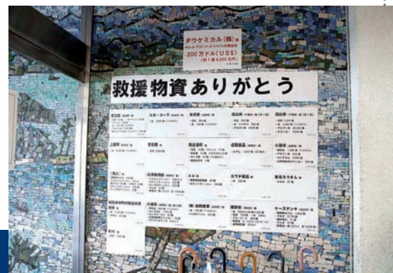
被災地に運ばれた救援物資は延べ20万個に