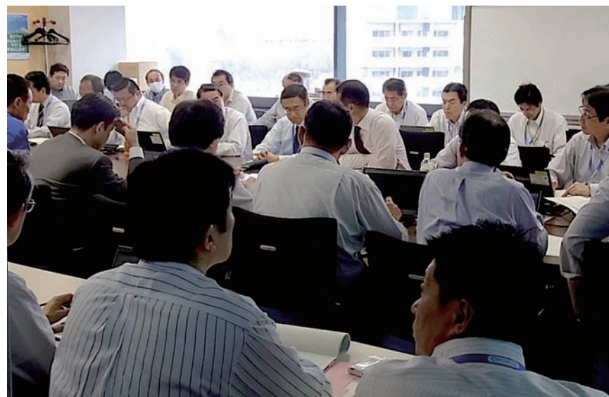
対策ミーティングに震災対応に関するあらゆる情報を集約した。震災発生直後は1日3回開催した

だが、救援物資をどれだけ運んでも、その食品や飲料は店舗には並ばない。非常時対応は何とか乗り切った。次は、店舗を修復し、店舗に並ぶ商品の配送を再開させなければならない。「カンフル剤」のような無償の救援物資でなく、「好きなものを選んで自分のお金で買える」という「日常」を取り戻すことなくして、マチの復興は始まらない。