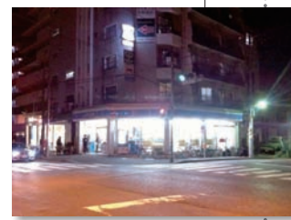
全国の店舗で看板などの照明を落として節電に協力した