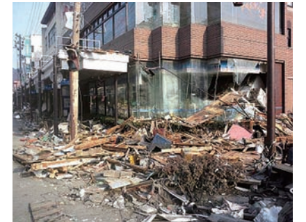
地震による破損、津波による流出など大きな被害が出た

これらを背景に震災後、議論と交渉を進め、新しい枠組みの補償制度「新・商品地震補償制度」を立ち上げた。現在すでに、ほぼ全店舗が加入している。