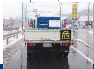
オーナーのローリーは京都から東京経由で東北へ向かった