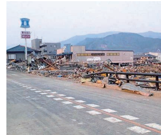
三陸沿岸に足を踏み入れると、光景は一変していた。下は江口が乗ったワゴン車。

そのまま開業できる店舗を「A」、少しの改修で再開できそうな店舗は「B」、大きな改装が必要な店舗は「C」。あえて大まかに分類したのは、その方がそれぞれの基準がぶれず、判断しやすくなると思ったためだ。後に、津波に流されて跡形もなくなった店舗のために「D」というランクを設けたが、概ねこの基準で分類された。