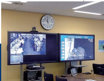
テレビ会議システムで、本社・支社の対策本部が結ばれ情報共有を図った