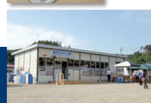
仮設住宅近くに店舗を構え、旧ローソン店舗の店員などを雇用している