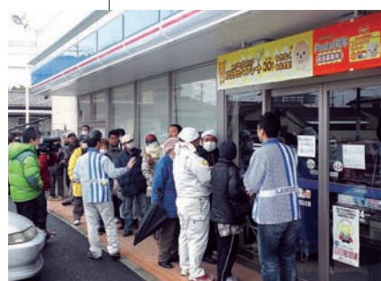
開店を待ちわびたお客様が行列を作った

福島第一原発事故の影響で一時休業していた、いわき市内11店舗、相馬市内1店舗、相馬郡新地町内1店舗の合計13店舗が営業を再開