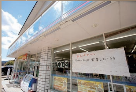
応援隊の活躍で泥をかき出し、営業を再開した巨理山元店。「みんなガンバレ」と書いて張り出した