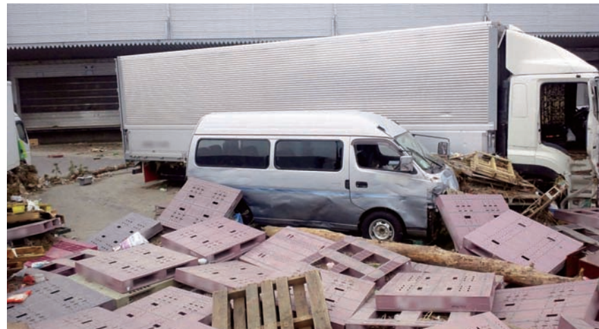
仙台CDCが被災したため、他地域のベンダーから商品を配送する必要性が生じた

閣府に自衛隊機での物資輸送を打診していたが、多忙のためか返答が届かず、16日の21時に突如「明後日、運ぶ」との連絡を受けた。準備のための時間はほぼ丸一日しかなかった。