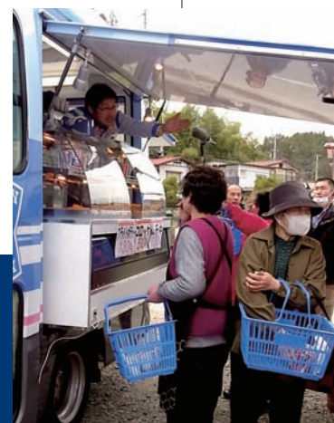
モバイルローソン号は、冷蔵ケースのほか、揚げ物調理設備などを備えていたため、できたての揚げ物などを提供できた

1トンコンテナ車を改造した移動販売車「モバイルローソン号」は、イベント用として2008年に導入されていた