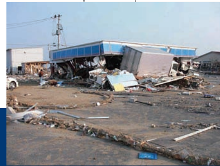
先遣隊は被災状況に応じて店舗をA～Dランクに分けた