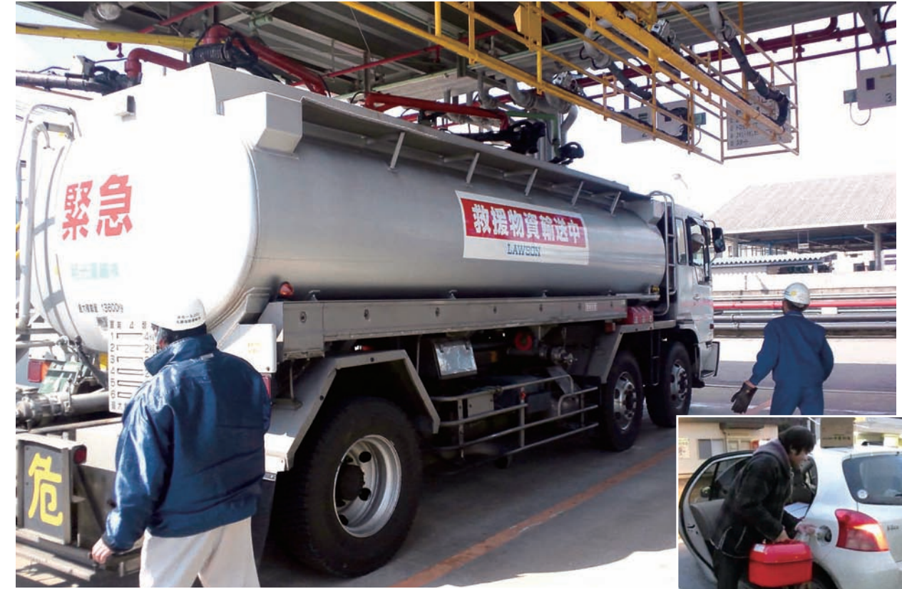
全国的に燃料の需給が逼迫。タンクローリーやその運転手も取り合いになった

新浪が燃料獲得の「特命」を下したが、上級執行役員・西口則一だった。西口は、店舗開発の畑が長く、全国の不動産事情に精通していた。その情報網を通じて、どこで誰が「油」を握っているか各地の「顔役」に電話を掛けて情報を収集できるだろう。加えて新浪が期待したのは「しつこさ」。命じられた