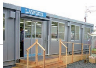
震災前には、岩手県陸前高田市に6店舗あったが、津波により全ての店舗が営業不能になっていた